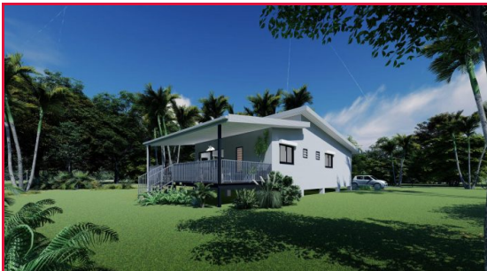
Vue façade Nord